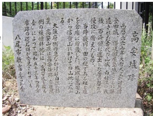
【右図】高安城跡石板

一方で昭和57年(1982年)に高安城の築城時期と一致する時代の土器の破片が倉庫跡から出土し、また平成11年(1999年)には高安山山中で城壁とみられる石垣の一部が発見されています。高安城がどこにあったのか現在も詳しい場所は分かっていませんが、今後の調査で幻の城の全容が明らかになる日も遠くはないかもしれません。